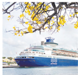
►► El Crucero a toda Roja aún dispone de 400 cabinas con paquetes todo incluido.

Si es uno de ellos y está pensando en emprender viaje, tenga claro algunas cosas: pasajes en avión aún hay, los hoteles están subiendo de precio y los traslados internos están a valores insólitamente caros. Las compañías aéreas dicen que en las últimas semanas se ha visto un mayor número de reservas para la segunda quincena de junio, pero mientras más se demore, probable-