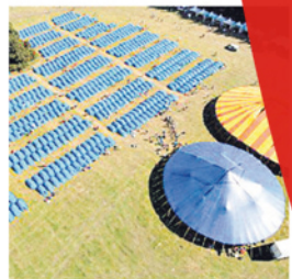
►► El Fútbol Fan Camp fue elegido como alojamiento por ChileArribadelaPelota.cl